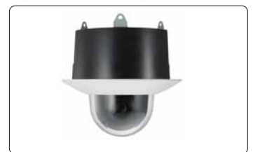
YT-ICB550/C Kit de empotramiento en el techo Domo claro

© 2006 Sony Corporation. Quedan reservados todos los derechos. Queda prohibida la reproducción total o parcial sin la debida autorización por escrito. Las características y especificaciones pueden verse sujetas a cambios sin previo aviso. Todos los pesos y medidas no métricas son aproximados. Algunas de las imágenes de este documento son simuladas. Sony es una marca registrada de Sony Corporation. IPELA, Exwave HAD, Memory Stick y VISCA son marcas registradas de Sony Corporation. Todas las demás marcas citadas pertenecen a sus propietarios correspondientes.