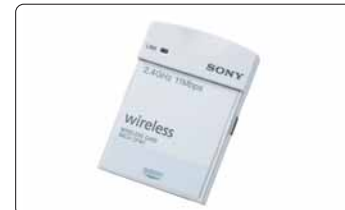
SNCA-CFW1 Tarjeta WLAN