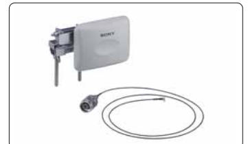
SNCA-AN1 Antena para conexión inalámbrica WLAN (Accesorio opcional para la tarjeta WLAN SNCA-CFW1)