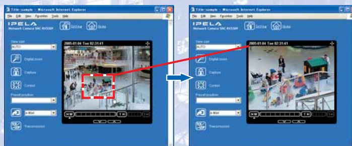
Funcionamiento intuitivo del GUI