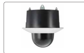
YT-ICB550/T Kit de empotramiento en el techo Domo tintado