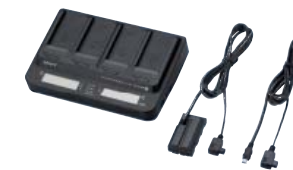
AC-VQL1BP Adaptador/cargador de CA