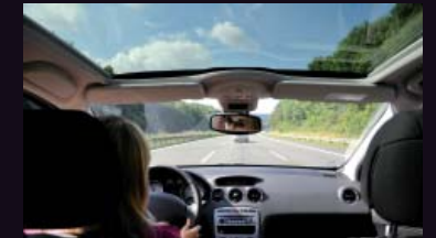
Con Active SteadyShot