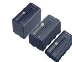
NP-F970/F770/F570 Baterías recargables InfoLITHIUM