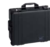
LCH-GT1BP Maleta de transporte rígida