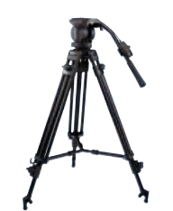
VCT-PG11RMB Trípode con control remoto RM-1BP