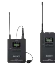
UWP-V1 Paquete de microfonía inalámbrica UHF