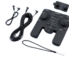
RM-1000BP Remote Commander