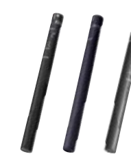
ECM-680S/678/673 Micrófono de condensador electret de tipo cañón