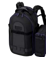
LCS-BP1BP Maleta de transporte