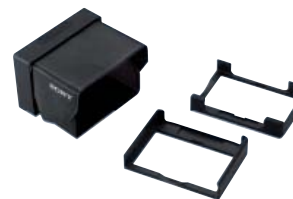
SH-L32WBP Parasol para la pantalla LCD