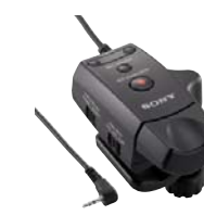
RM-1BP Control remoto