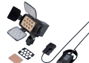
HVL-LBPA Antorcha LED