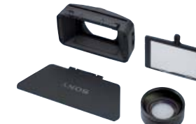
VCL-HG0872K Objetivo gran angular 0,8x con matte box