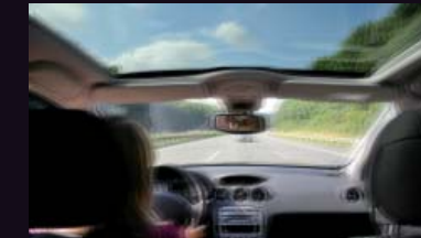
Sin Active SteadyShot

El HXR-NX5E ofrece dos formatos de grabación de audio: Dolby Digital estéreo o PCM Lineal estéreo. El último es capaz de grabar sonido sin comprimir con la calidad de un CD.