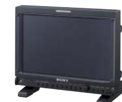
LMD-940W Monitor LCD profesional