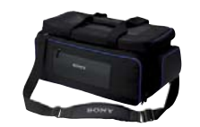
LCS-G1BP Maleta de transporte blanda